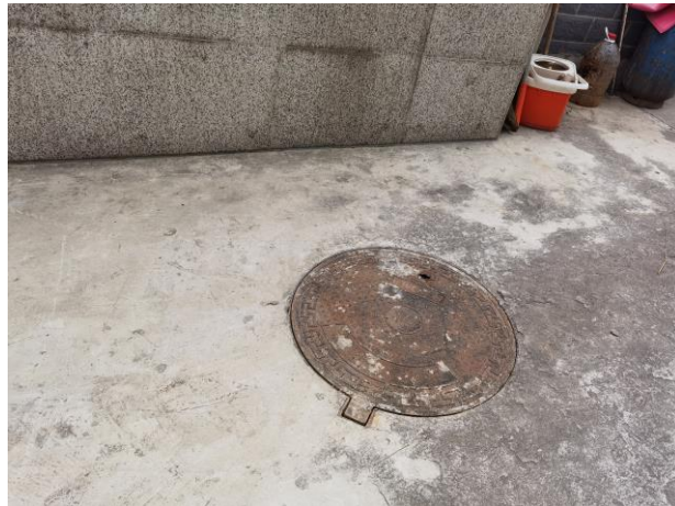
图 4-1 预处理池