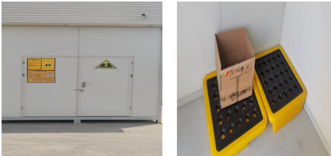
图 4-2 危废暂存间

根据现场调查，建设单位设置了 1 个危废暂存间，建筑面积为 10m 2 ，危废暂存间根据要求设置了警示标识，采取了重点防渗措施，并安装有通风装置，设置了防渗托盘，建立了危险废物管理规范，指定专人负责管理；落实了“四防”（防风、防雨、防晒、防渗漏）措施，防止事故泄漏污染地下水。同时，建设单位已与成都川蓝环保科技有限公司签订了危废处置协议，本次要求建设单位与有资质的单位补充签订危废协议（包含危废类别 HW08/900-249-08）。