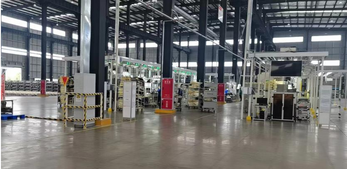
图 4-3 车间内灭火器材

为切实防范环境风险事故，本项目厂区内设有消防通道、消防水池、消防水箱、室外设消火栓，配置了足够的灭火器材，制定了危险废物管理和转移制度。